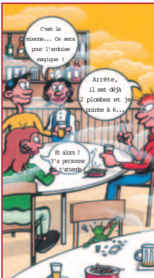
TRANCHE DE VIE DU LABYRINTHE DE VOTRE SAISON

Pour développer une action de prévention dans les stations de sports d'hiver, il est conseillé de s'appuyer sur des structures existantes, type Maison des Saisonniers, les collectifs déjà mis en place, comme les groupes santé ou encore d'autres relais.